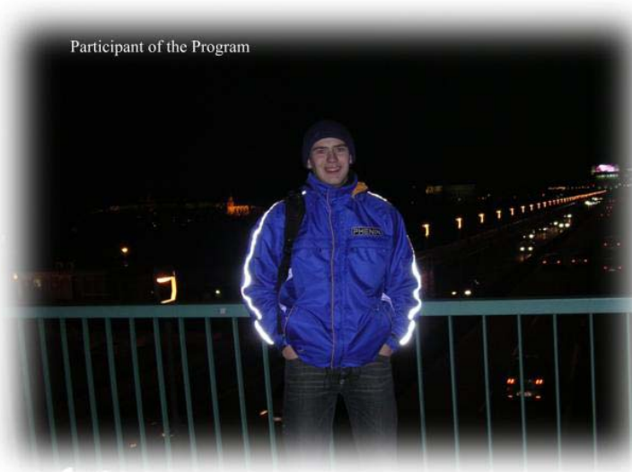
Participant of the Program

The only distressing thing about all this is that almost all Czechs do not speak English and sometimes some of them show ambiguity of attitude to nationals of former USSR